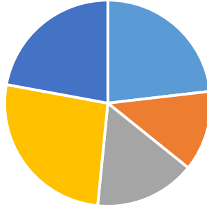
Grafik 1: Dış Paydaşlar Memnuniyet Oranları

■ Kesinlikle olumsuz ■ Olumsuz ■ Normal ■ Olumlu ■ Kesinlikle Olumlu